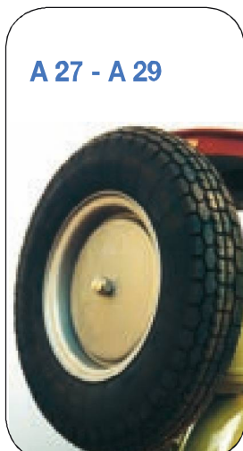
A 27 - A 29